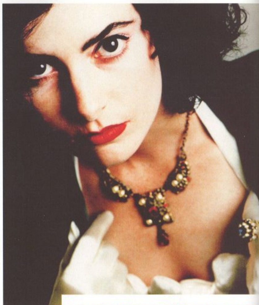
Les griffes de luxe sont nombreuses à investir les cyberventes privées.

Quelques bonnes affaires. Nous avons déniché un sac à main en cuir Roberto Cavalli à 90 euros au lieu de 470 euros sur showroomprive.com. Dans un autre genre, les amateurs de camping pouvaient trouver sur vente-privee.com une tente Trigano Mykonos 5 personnes à 125 euros contre 290 euros prix public.