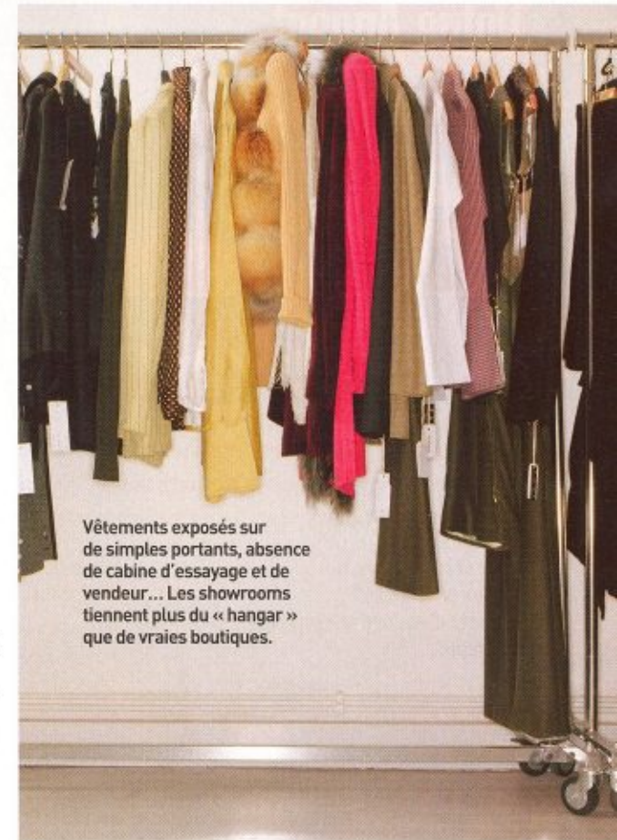
Vêtements exposés sur de simples portants, absence de cabine d'essayage et de vendeur... Les showrooms tiennent plus du « hangar » que de vraies boutiques.