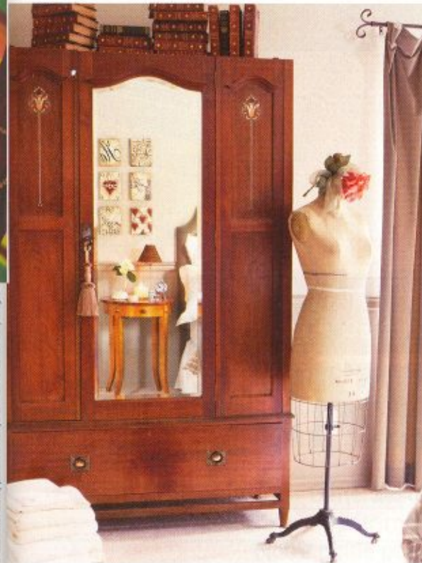
Vêtements, chaussures, mais aussi meubles, décoration... l'offre des magasins d'usine est très diversifiée.

Quelques bonnes affaires. La Maison du Cuir à L'Île-Saint-Denis proposait une valise Samsonite Cruisair II 67 cm à 105 euros au lieu de 149 euros. Toujours à la même adresse, nous avons trouvé à la boutique Aigle une parka Ocinev de la marque à 65 euros au lieu de 100 euros.